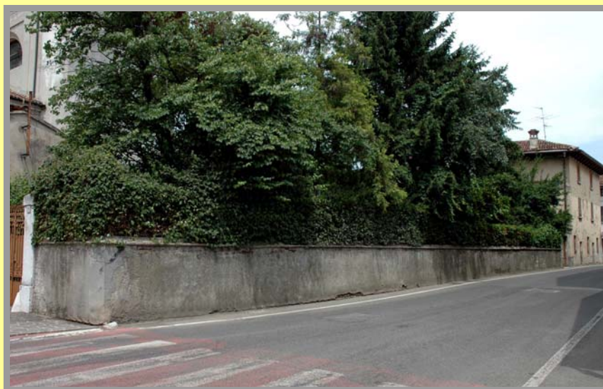
Scorcio della via