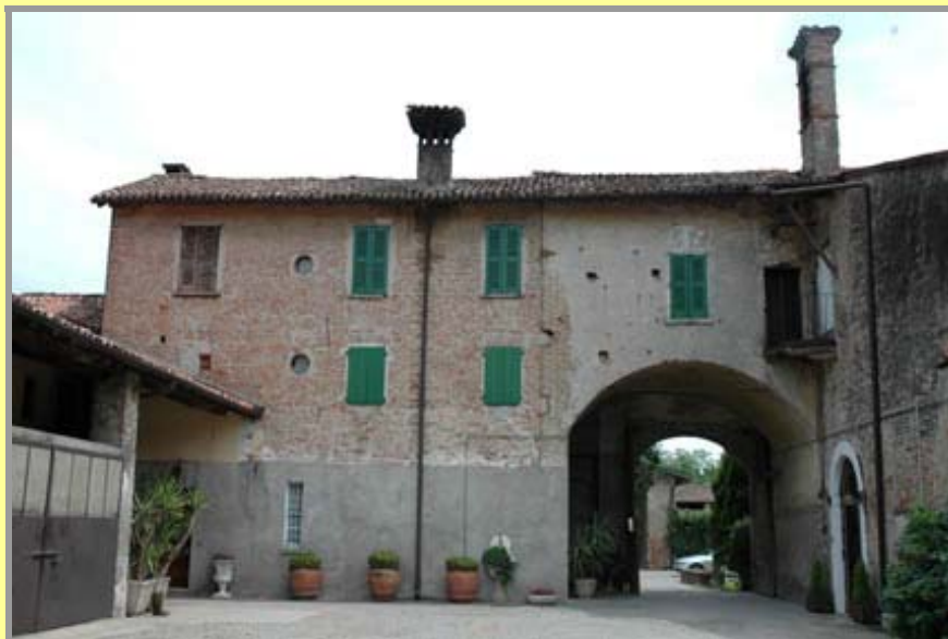
La corte interna