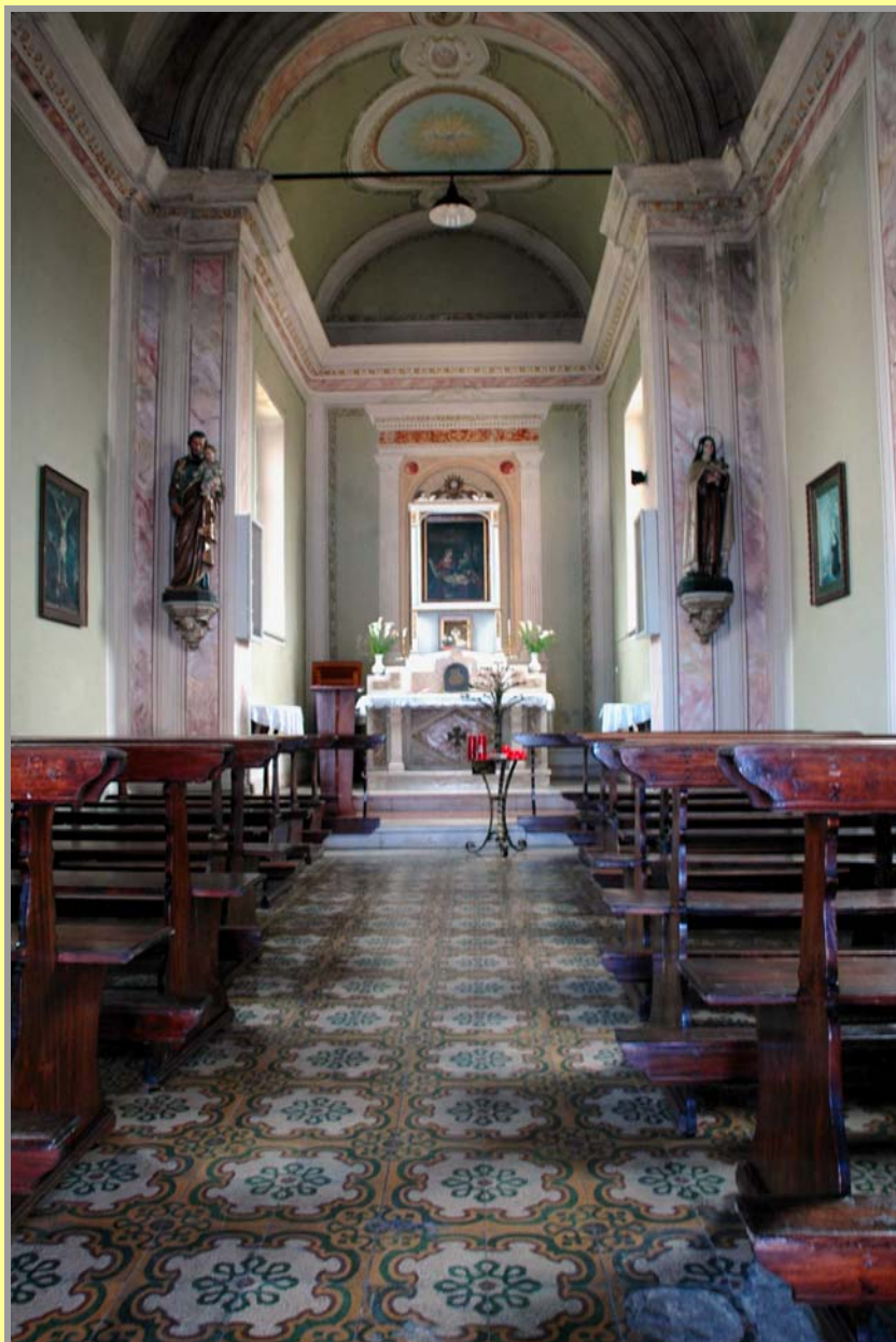
Interno della chiesa