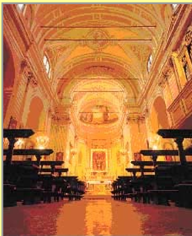
Interno della chiesa