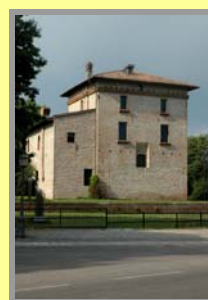
La Torre nella frazione di Boldeniga