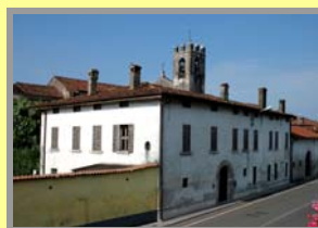
Scorcio della frazione di Corticelle