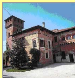
Castello di Dello